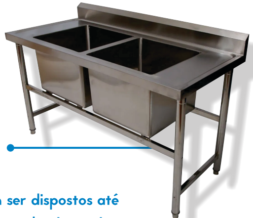
TANQUE INDUSTRIAL DE INOX ●

Os equipamentos de inox podem ser dispostos até mesmo em áreas sujeitas à lavagem de piso, pois os modelos com pés niveladores permitem que ele fiquem acima do chão.