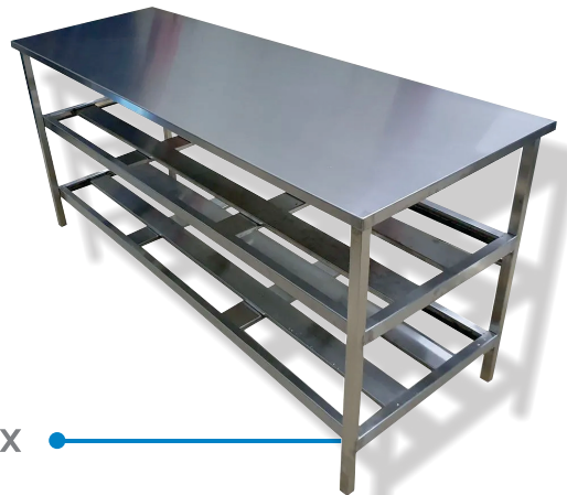
MESA INDUSTRIAL DE INOX ●